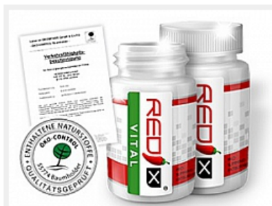
REDIX®-Vital online bestellen und den Weg zum Wunschgewicht starten